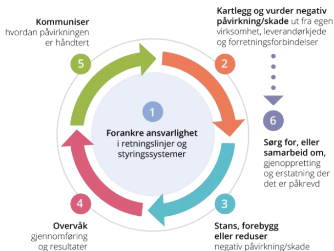
Figur 1 OECDs modell for aktsomhetsvurderinger for ansvarlig næringsliv.

Åpenhetsloven innebærer også at enhver har rett til informasjon om hvordan Norsk helsenett håndterer faktiske og mulige negative konsekvenser med bakgrunn i aktsomhetsvurderingene.